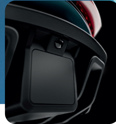
NEU: RÜCKWÄRTSGANG MIT RÜCKFAHRKAMERA