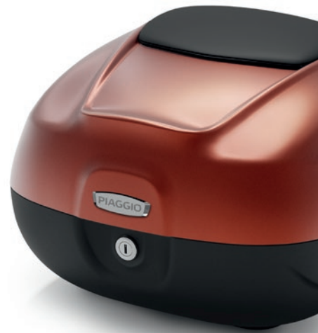
Topcase 37 Liter