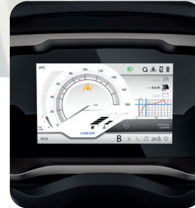
NEU: DASHBOARD MIT 7"-TFT-FARBDISPLAY