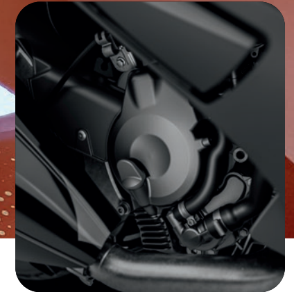
OPTIMIERT: 399 CM 3 EURO 5-MOTOR