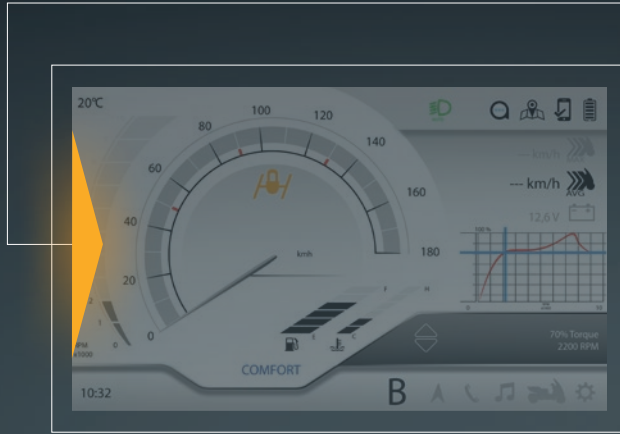
BLIS - BLIND SPOT INFORMATION SYSTEM - TOTWINKELASSISTENT