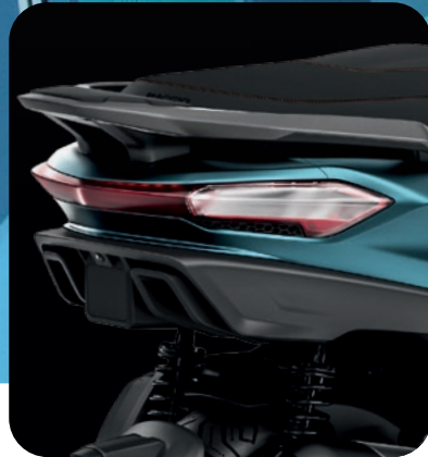
NEU: HOCHMODERNES DESIGN