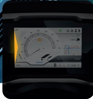
NEU: BLIS - BLIND SPOT INFORMATION SYSTEM - TOTWINKELASSISTENT