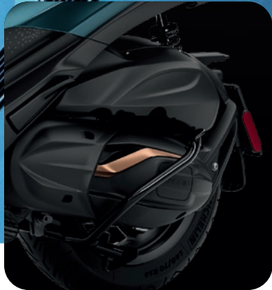
NEU: 530 CM 3 EURO 5-MOTOR