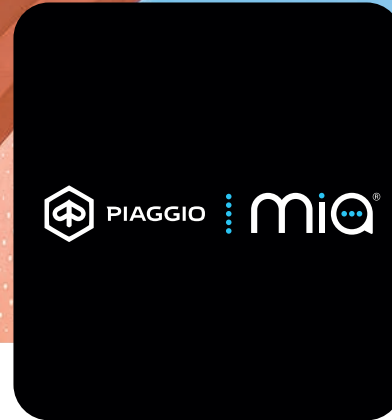
PIAGGIO MULTIMEDIA- PLATTFORM