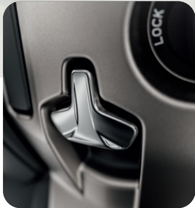
NEU: FESTSTELL- BREMSHEBEL