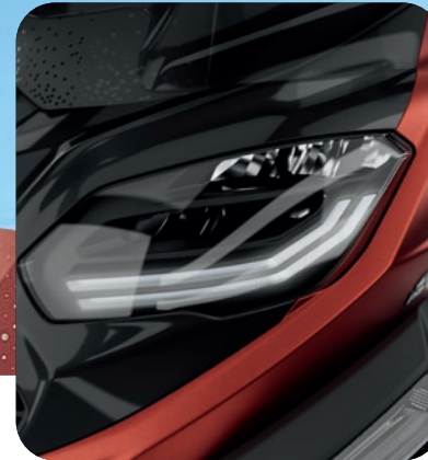
NEU: LED-SCHEINWERFER MIT LED-TAGFAHRLICHT