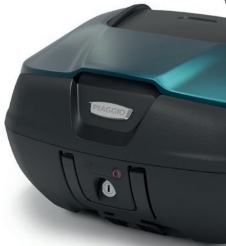
Topcase 52 Liter