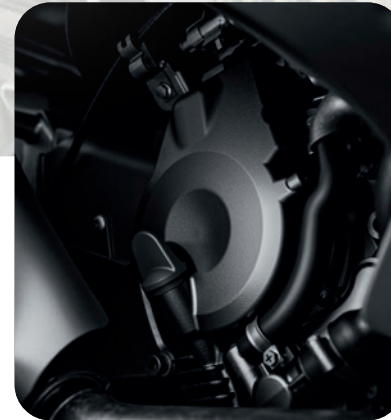
OPTIMIERT: EURO 5-MOTOR 5-MOTOR