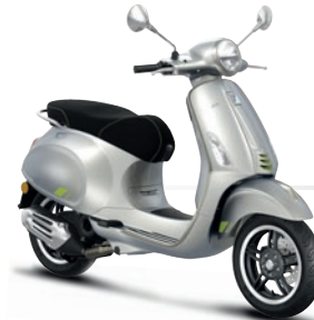
Grau Entusiasta G41