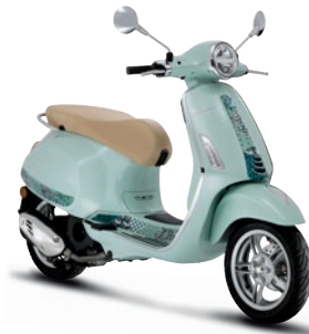
Grün Batik VK (350/A)