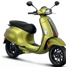
Grün Ambizioso matt V03