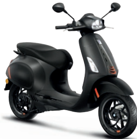
Schwarz Convinto matt NV