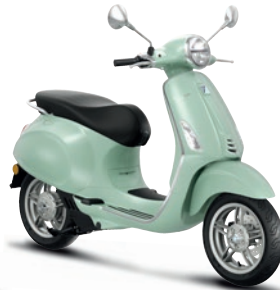
Grün Amabile VK (350/A)