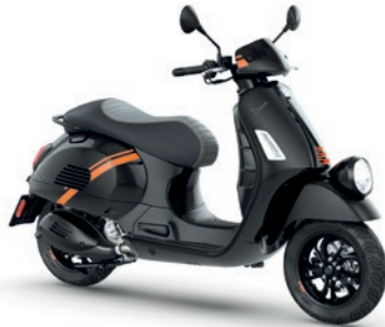
Schwarz Convinto XN2