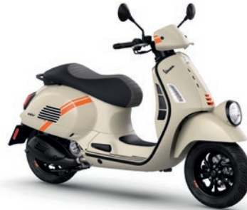
Beige Avvolgente matt Q03