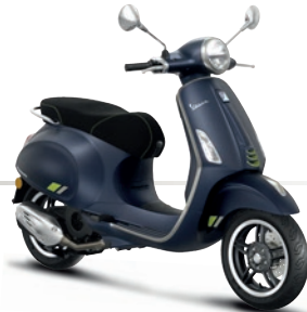
Blau Energico matt DY