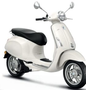
Weiß Innocente B04