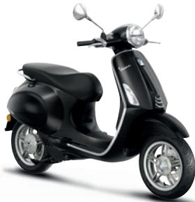
Schwarz Convinto XN2 (98/A)